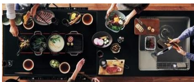
(写真：自由な使い方が楽しめる「対面操作マルチワイドIH ガラステーブルタイプ」)