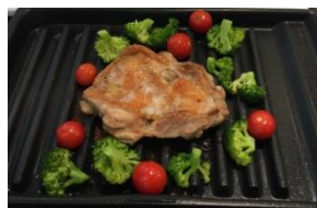
(調理例：チキングリル)

ご家族・ご友人お誘いあわせのうえ、 毎月1グループ限定イベント！ お気軽にご参加ください！ *もちろん、お一人様での参加も大歓迎です！！