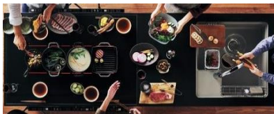
(写真：自由な使い方が楽しめる「対面操作マルチワイドIH ガラステーブルタイプ」)